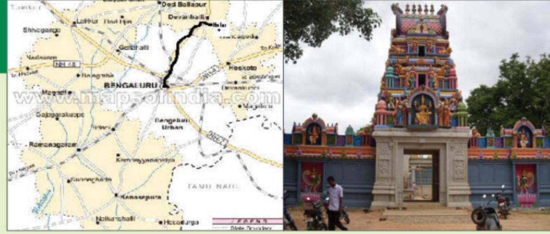
ನಲ್ಲೂರಿನ ರಸ್ತೆ ಮಾರ್ಗ

ಈ ತೋಪಿನ ಮಧ್ಯ ಭಾಗದಲ್ಲಿ ಶ್ರೀ ಚನ್ನಕೇಶವಸ್ವಾಮಿ ದೇವಾಲಯವಿದ್ದು, ಅದು ಶಿಥಿಲಾವಸ್ಥೆಯಲ್ಲಿದೆ. ಈ ಸ್ಥಳದ ಪಾರಂಪರಿಕ ಮೌಲ್ಯವನ್ನರಿತ ಕರ್ನಾಟಕ ಸರ್ಕಾರ ದಿನಾಂಕ: 24.01.2007ರಂದು ಈ ತೋಪನ್ನು "ಜೀವವೈವಿಧ್ಯ ಪಾರಂಪರಿಕ ತಾಣ" ಎಂದು ಘೋಷಣೆ ಮಾಡಿದೆ. ಇದು ದೇಶದ ಮೊದಲ ಜೀವವೈವಿಧ್ಯ ಪಾರಂಪರಿಕ ತಾಣವಾಗಿದೆ. ಇದರ ನಿರ್ವಹಣೆಯ ಜವಾಬ್ದಾರಿಯನ್ನು ಕರ್ನಾಟಕ ಜೀವವೈವಿಧ್ಯ ಮಂಡಳಿ ಮತ್ತು ಜೀವವೈವಿಧ್ಯ ನಿರ್ವಹಣಾ ಸಮಿತಿ, ನಲ್ಲೂರು ಗ್ರಾಮ ಪಂಚಾಯತಿ ಇವರಿಗೆ ವಹಿಸಿದೆ. ನಲ್ಲೂರು, ಬೆಂಗಳೂರು ಗ್ರಾಮಾಂತರ ಜಿಲ್ಲೆಯ ದೇವನಹಳ್ಳಿ ತಾಲೂಕಿನಲ್ಲಿದ್ದು (ಅಕ್ಷಾಂಶ: N 13° 11' 554", ರೇಖಾಂಶ: E 77° 46' 010" ಮತ್ತು ಸಮುದ್ರ ಮಟ್ಟದಿಂದ 892 ಮೀಟರ್ ಎತ್ತರದಲ್ಲಿದೆ) ಬೆಂಗಳೂರು ನಗರದಿಂದ ಸುಮಾರು 45 ಕಿ.ಮಿ ಮತ್ತು ಬೆಂಗಳೂರು ಅಂತರಾಷ್ಟ್ರೀಯ ವಿಮಾನ ನಿಲ್ದಾಣದಿಂದ 15 ಕಿ.ಮಿ ದೂರದಲ್ಲಿದೆ. ಇದು ಬೆಂಗಳೂರು-ಬಳ್ಳಾರಿ ರಾಷ್ಟ್ರೀಯ ಹೆದ್ದಾರಿ 7ರೊಂದಿಗೆ ಉತ್ತಮ ಸಂಪರ್ಕ ಹೊಂದಿದೆ.